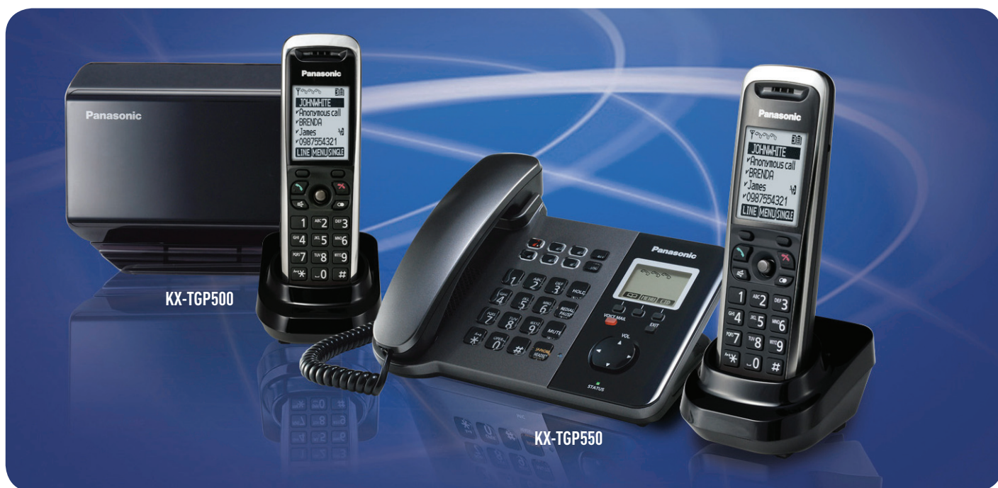
TGP500 - SISTEMA TELEFONICO PORTATILE SIP